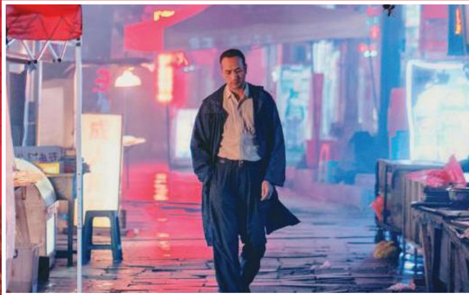
"Largo viaje hacia la noche" (película china, 2018)

Del Plan de Acción CELAC-China 2019-2021: "Cap. VII, punto 2: Promover el intercambio de artistas de distintas disciplinas...incentivar los intercambios y la cooperación tanto en expresiones culturales tradicionales como en las industrias culturales y creativas".