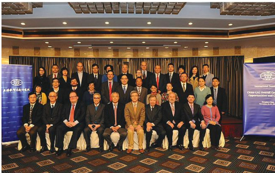
IV Forum - SIIS 24-25, Nov 2015

Siguiendo con la dinámica un año en China y un año en Latinoamérica, el 2016 Argentina fue el país anfitrión del V China – Latin America High Level Academic Forum Construyendo confianza estratégica y entendimiento mutuo. Distintos aspectos de la Relación China América Latina. Las entidades patrocinadoras fueron la Universidad Nacional de Córdoba y la Universidad Nacional de La Plata. Esta vez, el eje de discusión se focalizó en la relación China-América Latina teniendo a CELAC como interlocutor, frente a nuevos liderazgos chinos. Co-organizadores de este importante encuentro fueron el Centro de Investigaciones y Estudios sobre Cultura y Sociedad- CIECS-CONICET y el Centro de Estudios Chinos-Instituto de Relaciones Internacionales-CECHINO-IRI de la UNLP.