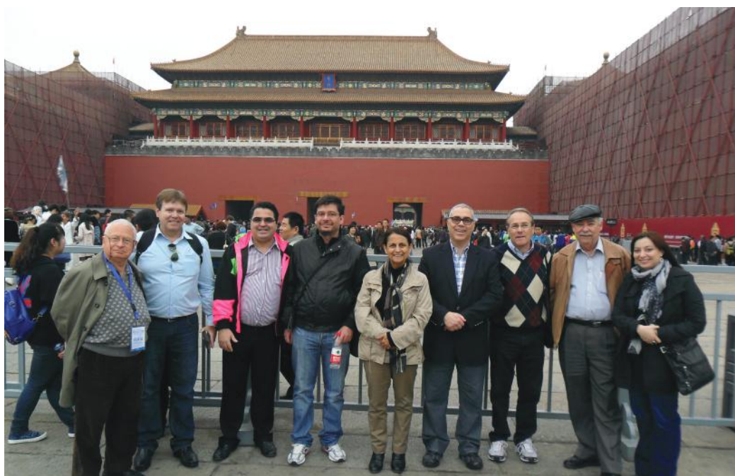
II Forum Octubre 2013 Deleg. en Ciudad Prohibida

Otros aspectos vinculados directamente al foro tienen relación con las diferentes publicaciones en revistas especializadas y libros, apoyados por China Social Sciences Press y la Editorial UNESP e Instituto Confucio de dicha Universidad. Un ejemplo de ello, es el libro dirigido por el Profesor Wu Baiji, Director General ILAS-CASS Oportunidades em meio a transformacao. Uma análise multidimensional das perspectivas de cooperacao entre China e América Latina publicado el 2016.